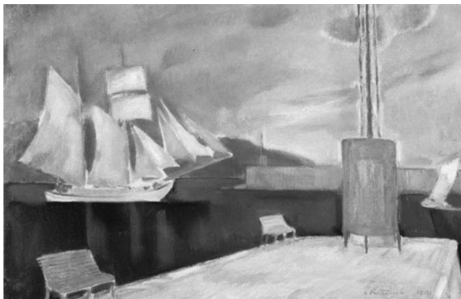
Κωνσταντίνος Παρθένος, Το λιμάνι της Καλαμάτας, 1911, λάδι σε μουσαμά, 70x75 εκ.

Η πianίστα Λορέντα Ράμου ξεναγεί παιδιά από 8 έως 12 ετών σε μουσικά και εικαστικά έργα που έχουν ένα κοινό: τη θάλασσα, την περιοδικότητα του ήχου των κυμάτων, την ένταση του παφλασμού, τη διάρκεια του απόηχου. Αυτά τα χαρακτηριστικά γνωρίσματα της θάλασσας γίνονται ο πυρήνας αυτού του εκπαιδευτικού προγράμματος. Κατά τη διάρκεια του εργαστηρίου, τα παιδιά ανακαλύπτουν πώς συνθέτες και εικαστικοί από όλο τον 20ο αιώνα συνδύασαν τους μουσικούς ήχους και την απεικόνιση του υγρού στοιχείου με τους ήχους της θάλασσας. Πόσο διαφορετικά είναι τα κύματα στη μουσική και τη ζωγραφική του 1900 από αυτά του 2000; Με όχημα μουσικά και εικαστικά έργα της ευρωπαϊκής τέχνης, τα παιδιά οδηγούνται στο να εκφράσουν τους δικούς τους, πρωτότυπους συνδυασμούς ήχου και εικόνας.