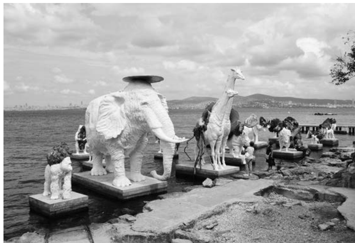
Εγκατάσταση του Adrian Villar-Rojas στην Μπιενάλε 2015 στην Κωνσταντινούπολη.

Το σεμινάριο υλοποιείται σε συνεργασία με τα Γραφεία Σχολικών Δραστηριοτήτων Α/θμιας και Β/θμιας Εκπαίδευσης Χίου. Θα δοθούν βεβαιώσεις συμμετοχής στους συμμετέχοντες εκπαιδευτικούς και δεν υπάρχει κόστος συμμετοχής. Οι αιτήσεις θα υποβληθούν διαδικτυακά στο σύνδεσμο που θα αποσταλεί από τα Γραφεία Σχολικών Δραστηριοτήτων των Διευθύνσεων Α/θμιας και Β/θμιας Εκπαίδευσης.